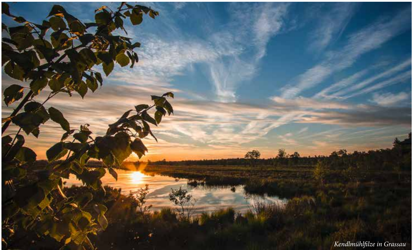
Kendlmühlfilze in Grassau